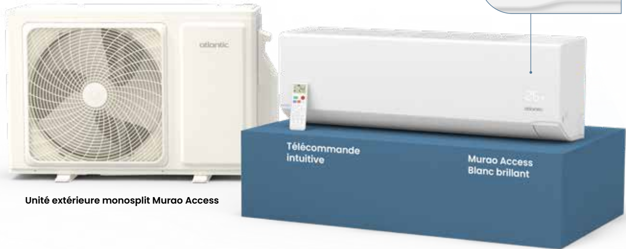
Unité extérieure monosplit Murao Access